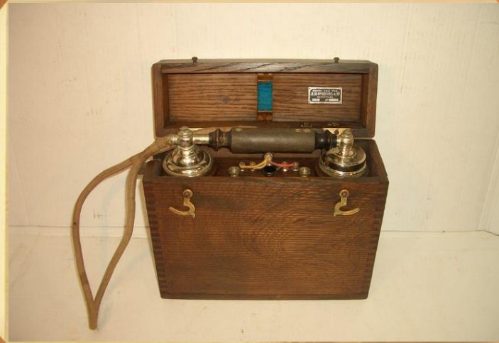
Полевой телефонный аппарат «Эриксон».