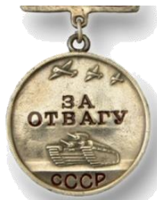
МЕДАЛЬ «ЗА ОТВАГУ»