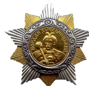
ОРДЕН БОГДАНА ХМЕЛЬНИЦКОГО