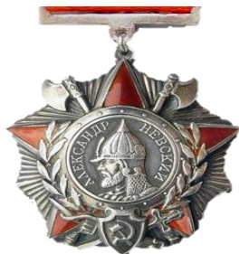
ОРДЕН АЛЕКСАНДРА НЕВСКОГО