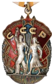
ОРДЕН «ЗНАК ПОЧЕТА»