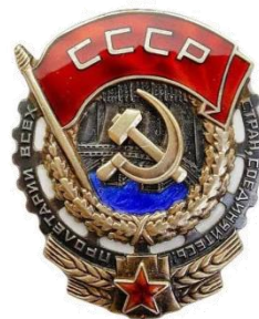
ОРДЕН ТРУДОВОГО КРАСНОГО ЗНАМЕНИ