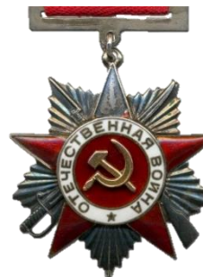
ОРДЕН ОТЕЧЕСТВЕННОЙ ВОЙНЫ