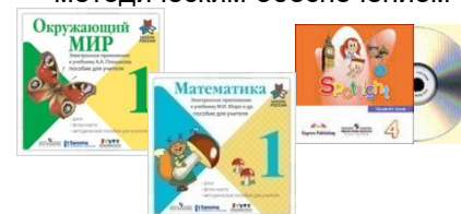
Электронные образовательные ресурсы