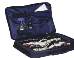
Модульная система экспериментов с программным и методическим обеспечением