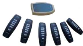
Система интерактивного тестирования с программным обеспечением