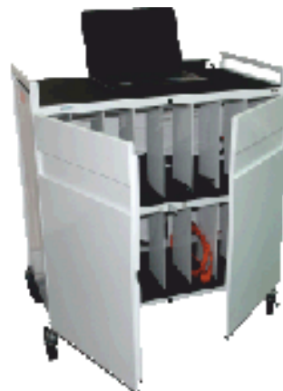
Сейф для хранения и зарядки нетбуков (ноутбуков)