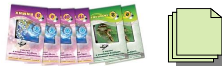
Инструктивно-методические материалы по использованию интерактивного оборудования и интернет-ресурсов, модульной системы экспериментов, интерактивной системы тестирования