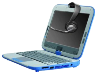
Нетбук (ноутбук) ученика с предустановленным программным обеспечением