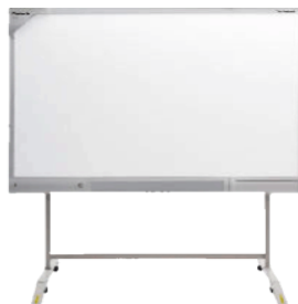
Интерактивная доска (или интерактивное устройство)