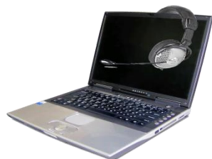
Ноутбук учителя с предустановленным программным обеспечением